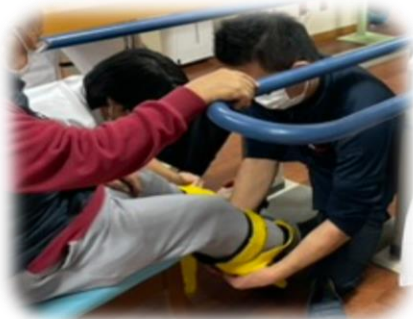
装具・補助具の相談